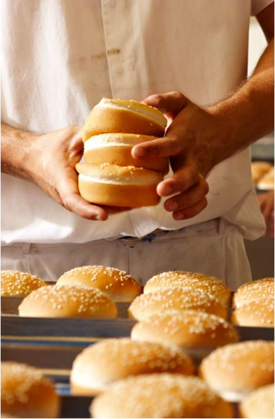
Kuvattu Ranskassa heinäkuussa 2009 leipomossa, joka leipoo McDonald's-keijulle sämpylöitä.