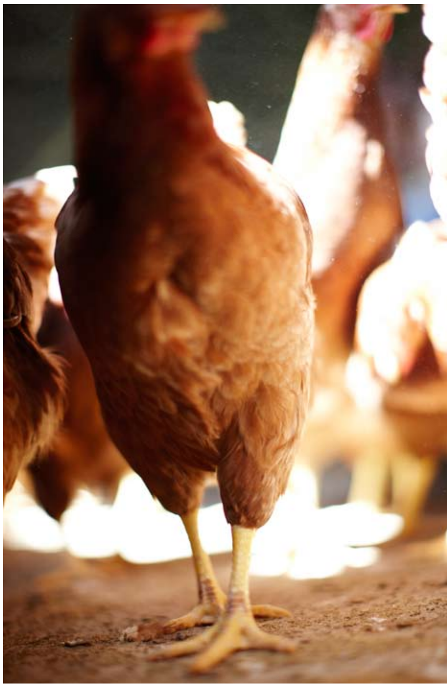
Kuvattu Le Nebourgissa Ranskassa heinäkuussa 2008 maatilalla, joka tuottaa McDonald's-keijun tavarantoimitajille kanatuotteita.