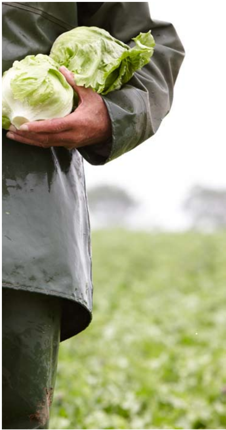
Kuvattu St. Pol de Léonissa Ranskassa heinäkuussa 2008 maatilalla, joka tuottaa McDonald's-keijun tavarantoimittajille avomaatuotteita.