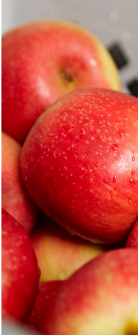
Kuvattu Ranskassa heinäkuussa 2009 tuotantolaitoksessa, joka toimittaa McDonald's-ravintoloille hedelmiä.