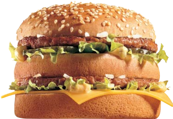
BIG MAC™ -KERROSHAMPURILAINEN

Valikoimiimme kuuluu myös kotimainen ruisleipä. Voimme tilauksesta valmistaa useat hampurilaisemme ruiskuoriin.