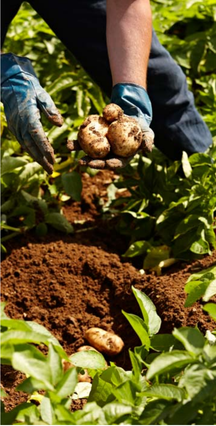
Kuvattu Ranskassa heinäkuussa 2009 maatilalla, joka tuottaa McDonald's-kefjun tavarantoimittajille perunoita.