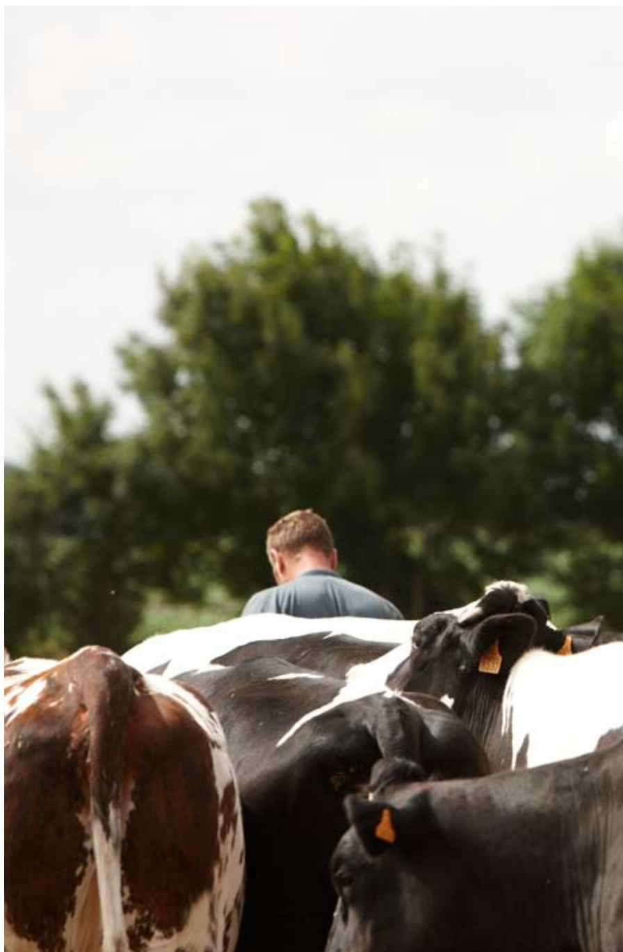
Kuvattu Le Neubourgissa Ranskassa heinäkuussa 2008 maatilalla, joka tuottaa McDonald's-keijun tavaranomittajille naudantihaa.