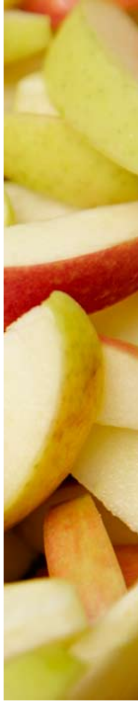
Kuvattu Perpignonnissa Ranskassa heinäkuussa 2008 tuotantolaitoksessa, joka toimittaa McDonald's-ravintoloille hedelmiä.